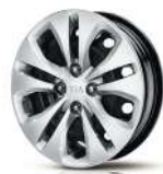
15-дюймовий сталевий з ковпаком