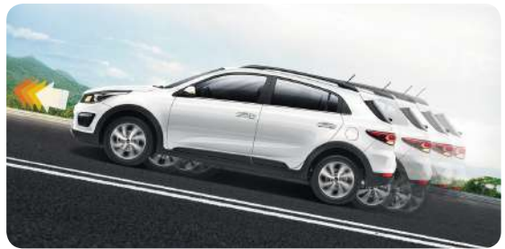
Система допомоги під час старту на підйомі.

Більше 50% деталей кузова виконано з високоміцних марок сталей, завдяки чому жорсткість кузова, його здатність захистити водія та пасажирів у випадку зіткнення, а також керованість автомобіля було суттєво покращено. Додатковий захист забезпечують 6 подушок безпеки.