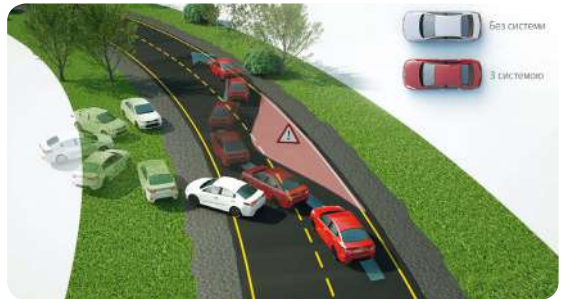
Система електронної динамічної стабілізації.