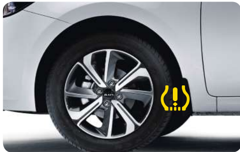
Система контролю тиску в шинах.