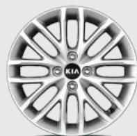
15-дюймовий легкосплавний диск