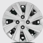
15-дюймовий сталевий диск