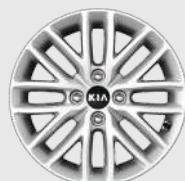
16-дюймовий легкосплавний диск

Зовнішній вигляд та оснащення автомобілів у автосалонах може відрізнятися від наведених у буклеті. Виробник має право вносити зміни в конструкцію та оснащення автомобілів без попереднього оголошення.